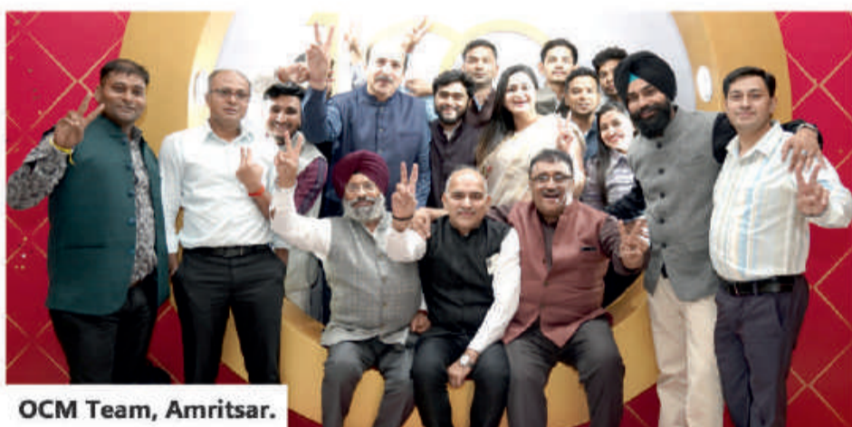
OCM Team, Amritsar.

Under the ownership of the Donear Group, India's leading lifestyle and fashion house, OCM has consistently evolved, embracing transformations across manufacturing, product development, and brand revitalization. Our extensive product range includes high-quality all-wool and wool-blended worsted fabrics, reflecting the forefront of global styling. The in-house Quality Assurance Laboratory, accredited by NABL since 2015, underscores our commitment to maintaining the highest standards.