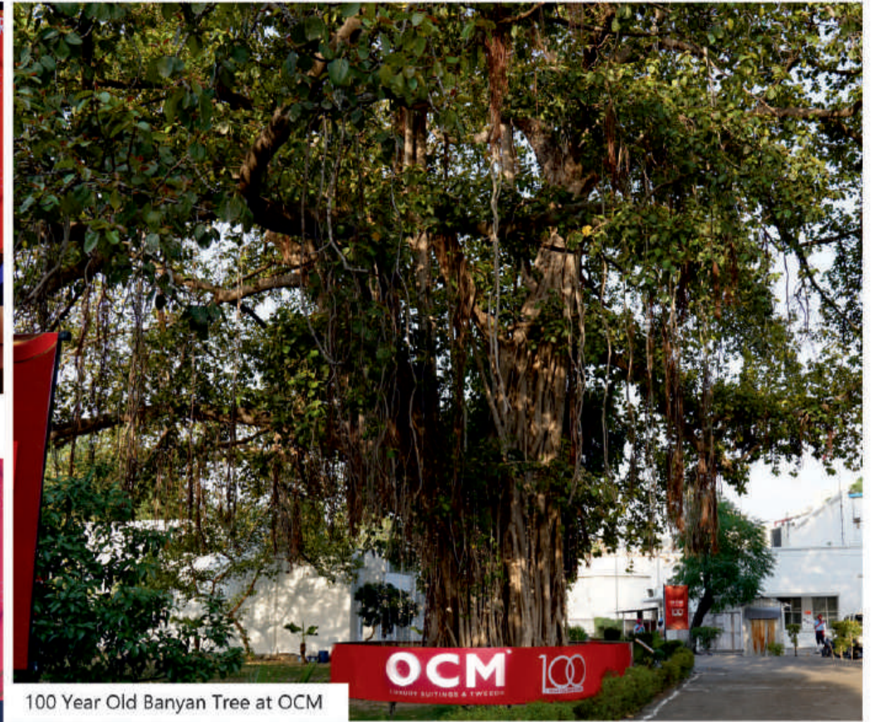
100 Year Old Banyan Tree at OCM