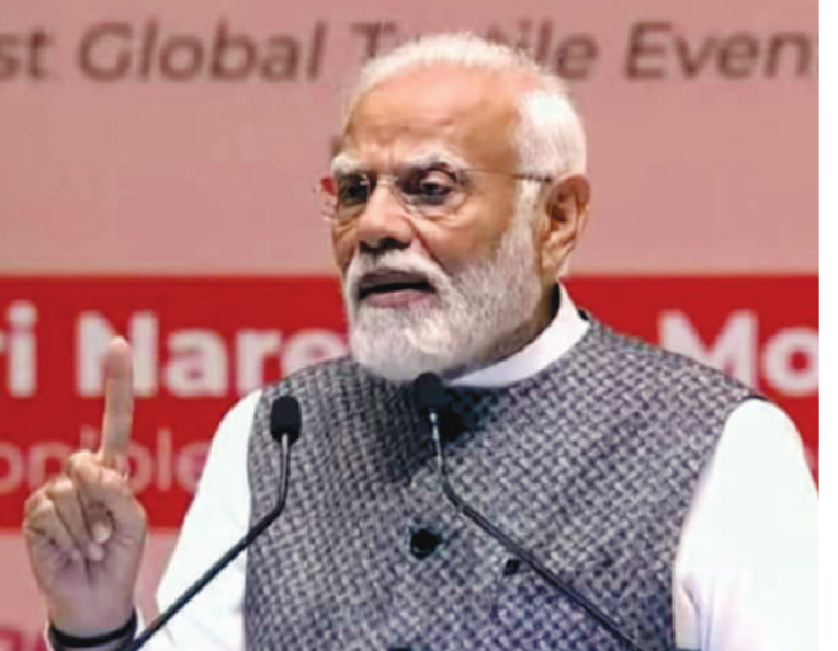
टेलिगट एवं ट्रेनिंग पर फोकस किया जा रहा है। साथ ही टेक्सटाइल वेल्थ चैन की सभी कड़ियों को SF (फार्म, फाइबर, फैक्ट्री, फैशन) से जोड़ें हुए फॉरन) के युग से एक दूसरे को जोड़ रहे हैं।

नई दिल्ली/ 26 से 29 फरवरी, 2024 को देश की राजधानी स्थित भारत मण्डप-प्रति मैदान एग्जीबिशन सेंटर में सबसे बड़ी टेक्सटाइल एग्जीबिशन 'भारत टेक्स 2024' का भव्य आयोजन किया गया। एक्सपोर्ट प्रमोशन काउंसिलस द्वारा भारत सरकार के टेक्सटाइल मंत्रालय के सहयोग से आयोजित इस एग्जीबिशन का उद्घाटन भारत के यशस्वी प्रधानमंत्री श्री नरेन्द्र मोदी, केन्द्रीय उद्योग मंत्री श्री पीयूष गोयल एवं टेक्सटाइल राज्य मंत्री श्रीमति दर्शना जरादशा ने किया। इस अवसर पर सभा को संबोधित करते हुए प्रधानमंत्री ने 'भारत टेक्स 2024' में सभी का स्वागत किया और कहा कि आज का अवसर विशेष है, क्योंकि विकसित भारत के निर्माण में टेक्सटाइल सेक्टर का योगदान और बढ़ाने के लिए हम बहुत विस्तृत दायरे में कार्य कर रहे हैं। जिसके लिए ट्रेडिशन, टेक्नोलॉजी,