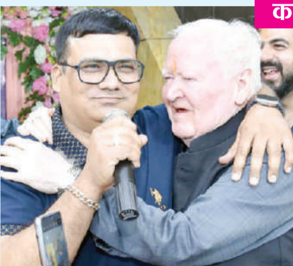
कमल उत्सव, कानपुर