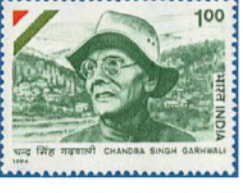
Chandra Singh Garhwali at 1994 Stamp of India.